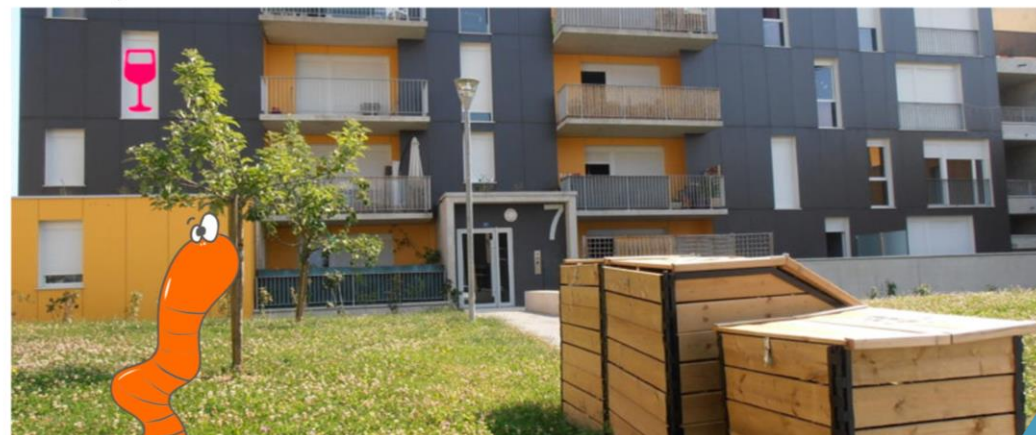
En pied d'immeuble