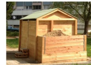
Dans mon quartier