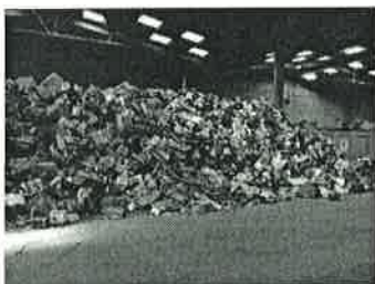
Visite de Juratri – Stock de DEEE sur 3 jours (petits appareils électriques en mélange)

Les interventions ainsi que les déplacements en bus vers Lons le Saunier sont intégralement pris en charge par Eco-Système dans la limite de 6000 € HT par an. Pour cette action, le budget s'élève à 5 200 € HT (pris en charge intégralement).