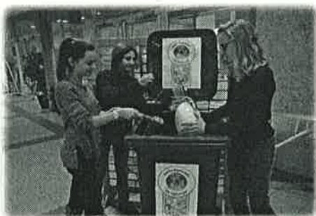
Collecte ponctuelle de DEEE mise en place dans les collèges participants